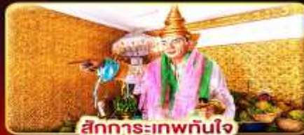
สักการะเทพพันใจ