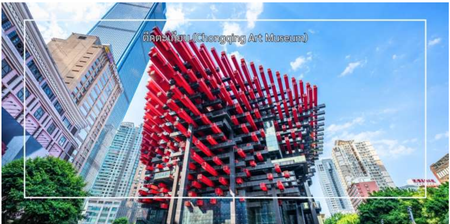
ตึกตะเกียบ (Chongqing Art Museum)

นำท่านสัมผัสความสวยงามของ ตึกตะเกียบ (Chongqing Art Museum) แลนด์มาร์คสุดแปลกตาใจกลางเมือง ที่ออกแบบอาคารให้มีลักษณะคล้ายตะเกียบยักษ์สีแดง-ดำซ้อนกันอย่างโดดเด่น อาคารแห่งนี้เป็นที่ศูนย์จัดแสดงศิลปะร่วมสมัยและจุดถ่ายภาพยอดนิยมของนักท่องเที่ยว ด้วยดีไซน์ทันสมัยและเอกลักษณ์เฉพาะตัว ทำให้ที่นี่กลายเป็นหนึ่งในสถานที่ที่ต้องมาเยือน