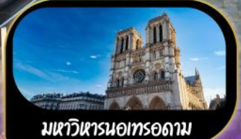
มหาวิหารนอทรอดาม