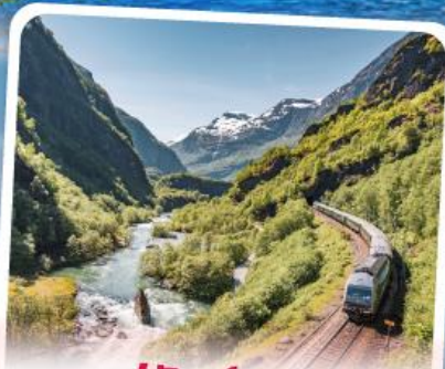
พลัมส์บานา รถไฟเส้นทางสายโรเมนติก