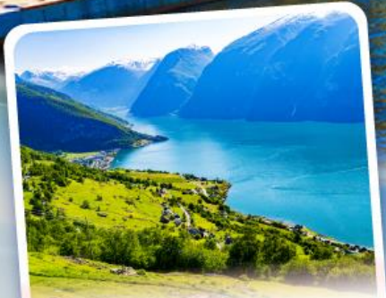
ช่องฟยอร์ด