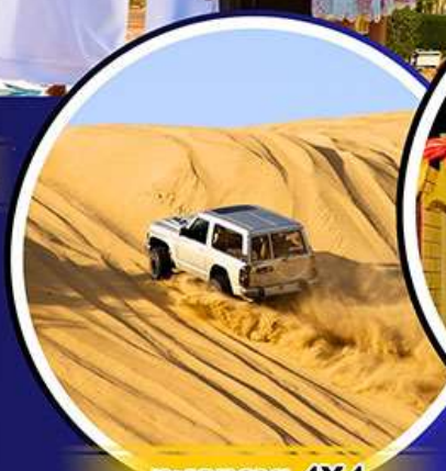
รถเช่าราย 4X4