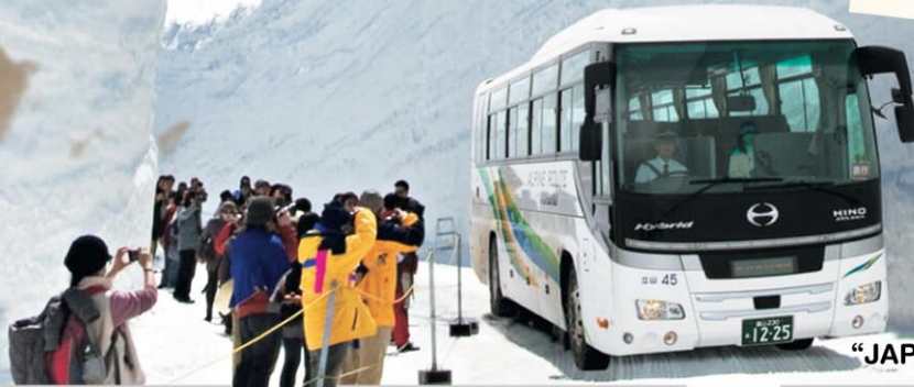
“JAPAN ALPINE ROUTE”