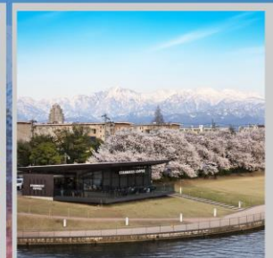
“TOYAMA KANSUI PARK”