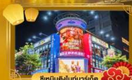
ช้อปปิ้งในทาวน์มาร์เก็ต