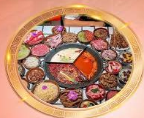
บุฟเฟต์หม้อไฟลงช้าง