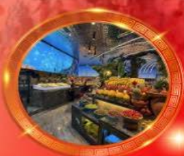
มือพิเศษ บุฟเฟต์นานาชาติ