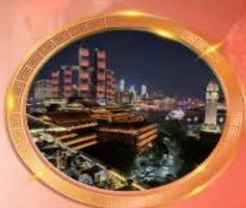
มือค้ำร้านอาหารวิวหลักล้าน