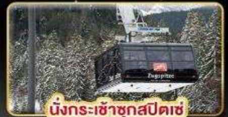
นั่งกระเช้าชุกสปีตซ์