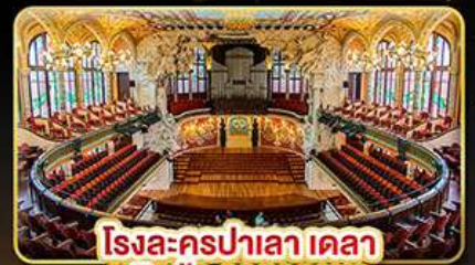
โรงละครปาเลา เดลา มูสิกา คาสาลานา