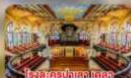
โรงละครปลัสเดลาเดลา มูสิคก้า คาตาลาซา