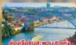
ล่องเรือชมสะพาน 6 แห่ง ในคูร์เมืองปอร์โต