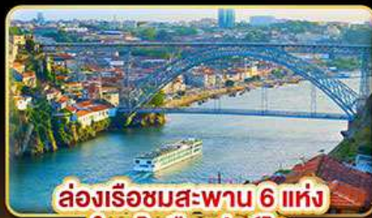
ล่องเรือชมสะพาน 6 แห่ง ในคูโรเมืองปอร์โต