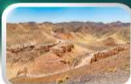
ซารินแกรนด์แคนยอน