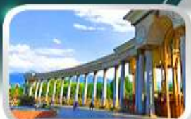
1st President Park