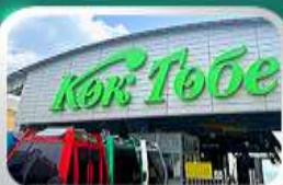
ซิมบูคโทเบซิมวออลมาตี

นั่งกระเช้าซิมบูลัค-ทะเลสาบโคลไซ-โบสถ์เซมคอฟ