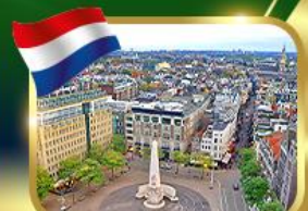
จัตุรัสดีนสแควร์ อัมสเตอร์ดัม