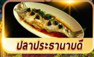
ปลาประรานาบดี