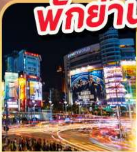
ย่านซีเหมินติง