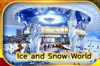
Ice and Snow World