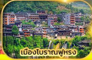
เมืองโบราณฟูหลง