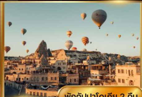
พิกคิปปาโดเกีย 2 คืน