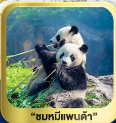
“ชมหมีแพนด้า”