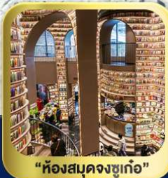
“ห้องสมุดจงชู่เก๋อ”