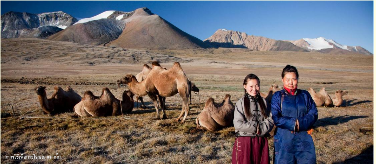
ภาพใช้เพื่อการโฆษณาเท่านั้น

นำท่านร่วมกิจกรรม พิธีต้อนรับแขกสไตล์มองโกล เป็นประเพณีโบราณที่มีมาช้านาน ชาวมองโกลมีอุปนิสัยที่รักเพื่อนฝูงและตรงไปตรงมาไม่เสแสร้ง เมื่อมีเพื่อนหรือแขกมาเยือนก็มักจะผูกมิตรอย่างจริงจัง และนำท่านร่วมกิจกรรม สวมใส่ชุดมองโกล สัมผัสพลังแห่งบรรพบุรุษ สวมเสื้อคลุมแบบดั้งเดิมที่มีสีสันสดใส ปักลวดลายอันประณีต คุณจะสัมผัสได้ถึงพลังแห่งบรรพบุรุษที่เคยปกครองดินแดนครึ่งโลก การสวมหมวกขนสัตว์ ผูกสายรัดเอว พร้อมเครื่องประดับเงินแท้ที่ส่องแสงระยิบระยับ จะทำให้ท่านเสมือนกลายเป็นนักรบแห่งทุ่งหญ้า พร้อมเครื่องประดับเงินแท้ที่ส่องแสงระยิบระยับ ของชนเผ่าที่เคยปกครองดินแดนครึ่งโลก เมื่อคุณยืนท่ามกลางทุ่งหญ้าไร้ขอบเขต