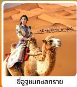
ขี่อูฐชมทะเลทราย