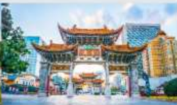
ประตูน้ำทองไก่อ๋หยก