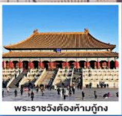
พระราชวังต้องห้ามปักกิ่ง