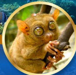
ลิงทาร์เซีย