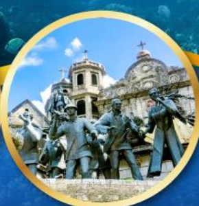
อนุสาวรีย์มรดกแห่งเซบู