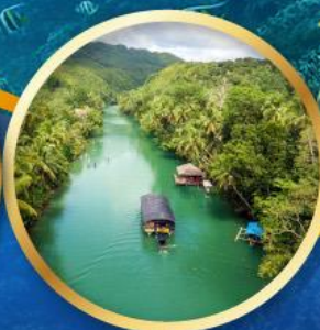
ล่องเรือแม่น้ำโลบ็อก