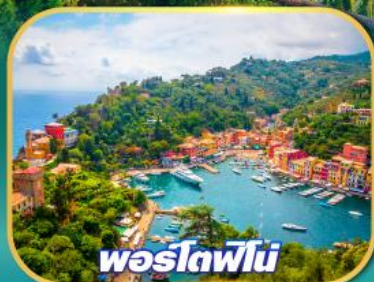
พอร์โตฟีโน