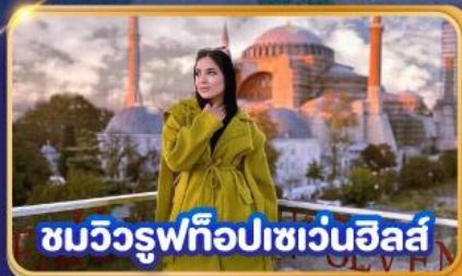
ชมวิวยุโรปที่อปเซเวนฮิลส์