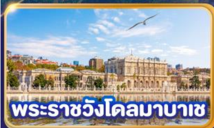
พระราชวังโดลมาบาซ