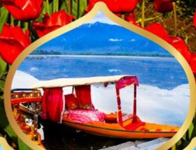
ล่องเรือชิคาร่า