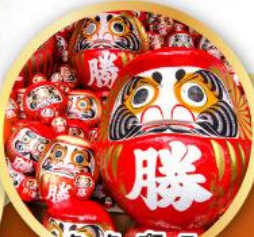
วัดคัตสึโฮจิ (วัดदारุมะ)

ชมความงามของกำแพงหิมะ เส้นทางสายอัลไพน์ทาเคยาม่า (JAPAN ALPS SNOW WALL)