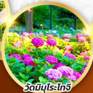
วัดมิมุโระโทจิ