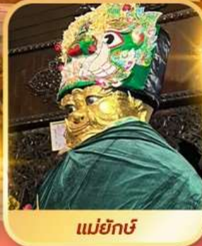
แม่ยักษิ์