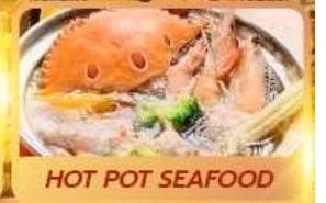
HOT POT SEAFOOD