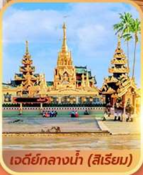
เจดีย์กลางน้ำ (สิริเยม)