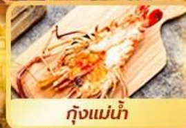
กุ้งแม่น้ำ