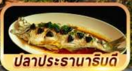
ปลาประรานาธิบดี