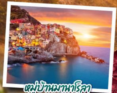
หมู่บ้านมานาโรคา