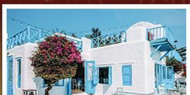
SON TRA MARINA CAFE

03 มี.ย. - 05 มี.ย. 69 14,800 // 19 มี.ย. - 21 มี.ย. 69 14,800 // 03 ก.ค. - 05 ก.ค. 69 15,800 07 ส.ค. - 09 ส.ค. 69 14,800 // 12 ส.ค. - 14 ส.ค. 69 15,800 // 28 ส.ค. - 30 ส.ค. 69 14,800 04 ก.ย. - 06 ก.ย. 69 15,800 // 18 ก.ย. - 20 ก.ย. 69 15,800