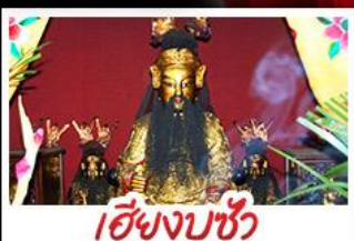
เหยิงบูชิว