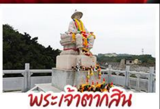
พระเจ้าตากสิน