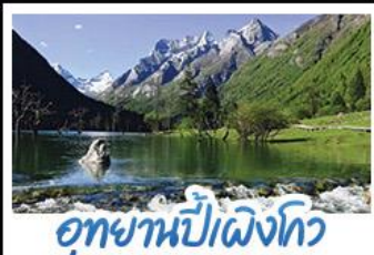
อุทยานปักธงโกว

ภูเขาสี่ดรุณี อุทยานจิวจ้ายโกว นั่งรถไฟความเร็วสูง น้ำพุไม่ไผ่ตักSKP อุทยานปักธงโกว วัดต้าฉือ ถนนโบราณชอยกวางชอยแคบ ช้อปปิ้งถนนไถ่กู่หลี่ + ถนนซุนซี้ลู่