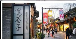
ถนนความจำ