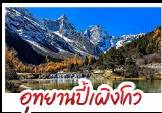
อุทยานป่าเผิงโกว

อุทยานสี่ดรุณี - อุทยานป่าเผิงโกว - อุทยานจิวจ้ายโกว รถไฟความเร็วสูง - EASTERN SUBURB MEMORY ถนนโบราณความจำย - วัดต้าฉือ ช้อปปิ้งย่านดิง ถนนไท่กู่หลี่ + ถนนซุนซีลู่