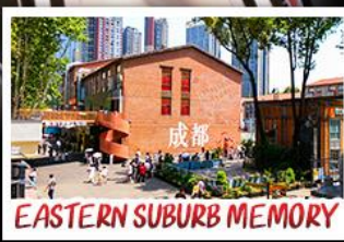
EASTERN SUBURB MEMORY