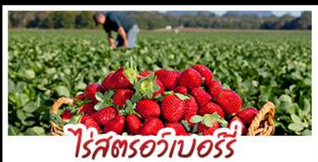
ไร่สตรอบอร์รี่

คฤหาสน์เหวินเจิง - สวนซาถูระชิงเต่า ไร่สตรอบอร์รี่ - โรงเบียร์ชิงเต่า