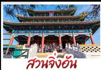
สวนจิ้งอัน