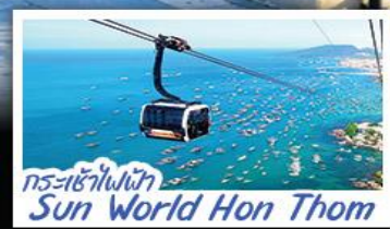
กระเช้าไฟฟ้า Sun World Hon Thom