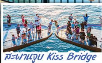
สะพานจูบ Kiss Bridge