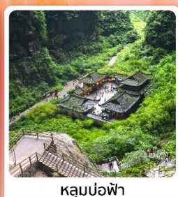
หลุมบ่อฟ้า