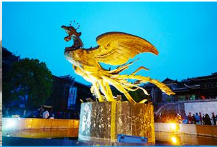
จัตุรัสหงส์