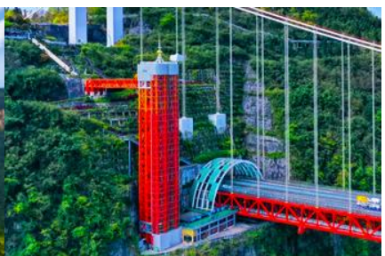
ลิฟท์แก้วอุทยานไร่จ้าย