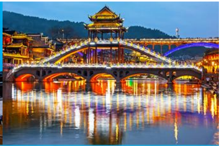
สะพานหงเจียว