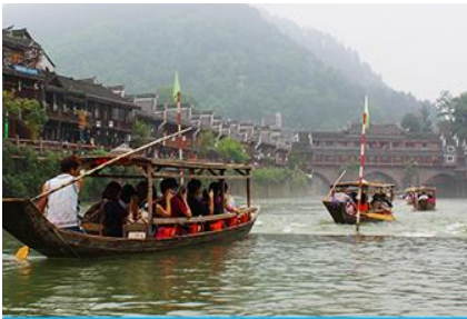
ล่องเรือแม่น้ำถั่วเจียง

หมายเหตุ การเดินทางเข้าเมืองโบราณฟางหวง ต้องนั่งรถเมล์ของเมืองโบราณ ท่านจำเป็นต้องหิวกระเป๋าสัมภาระของท่านขึ้น-ลงรถเมล์ด้วยตัวท่านเอง เพราะรถบัสทัวร์เราไม่สามารถเข้าไปในเมืองโบราณได้ จอดส่ง ณ จุดขนส่งของเมืองโบราณเท่านั้น เมื่อเดินทางถึงเมืองโบราณฟางหวงแล้ว นำท่านเช็กอิน ณ โรงแรมที่พัก(อยู่ในเมืองโบราณใกล้แหล่งท่องเที่ยว)