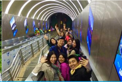
บันไดเลื่อนทะลุภูเขา