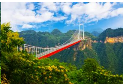
สะพาน ไร่จ้ายต้าเจียว