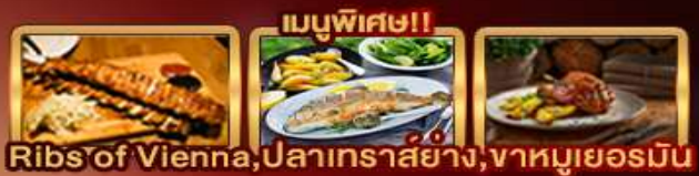
Ribs of Vienna, ปลาเทราสย่าง, ฆาตกรรมเยอรมัน

Zugspitze Munich Salzburg Hallstatt Bratislava