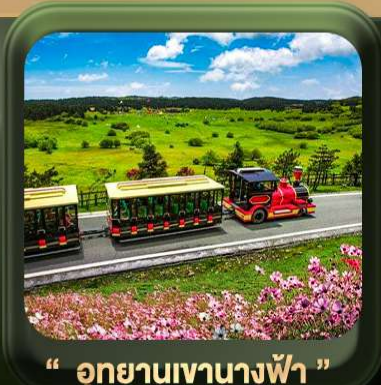
“ อุทยานเขานางฟ้า ”

T2G-CKG26CZ Special of Chongqing... วงซิ่ง ต้าจู้ อุ้หลง อุทยานหลุมฟ้า เขานางฟ้า 5D 3N (CZ)