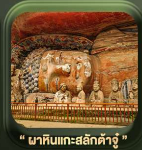
“ พาหินแคะสลักต้าจู้ ”