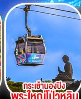
กระเช้าองปีง พระใหญ่โป่วหลิน