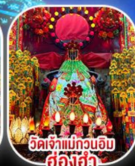
วัดเจ้าแม่กวนอิม ฮ่องฮำ