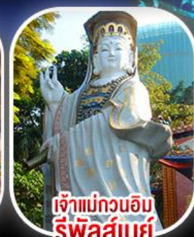
เจ้าแม่กวนอิม รีพีลส์เบย์