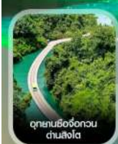
อุทยานชิงจื่อทวน ด่านสิงโต