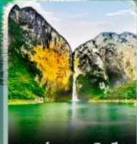
แกรนด์แคนยอนชิงเจียง