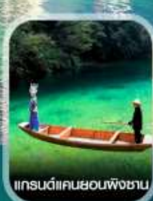
แกรนด์แคนยอนผิงซาน

✈️ คอมพิวเตอร์ออกเดินทาง ✈️ ทุกพีเรียด 2 ท่านขึ้นไป