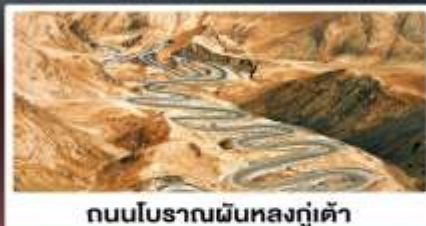
ถนนโบราณผืนหลงกู่เต้า