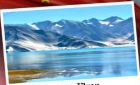
ทะเลสาบไปซาทุ

เปิดประตูสู่อารยธรรมพันปีแห่งซินเจียงใต้ ชมความสวยงามของหมู่บ้านดอกแอปเปิ้ล