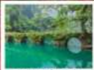
อุทยานเสี่ยวซีโง