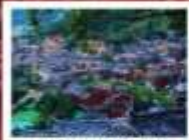
หมู่บ้านแม่วชิเจียง