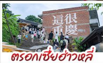
ตรอกเซี่ยฮ่าวหลี่