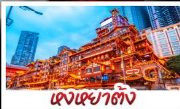
เจงเฉาตัง