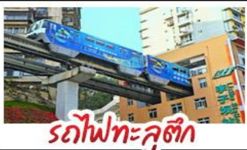
รถไฟทะลุติ๊ก