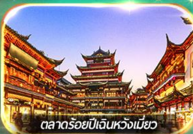
ตลาดร้อยปีเงินหวังเหมียว