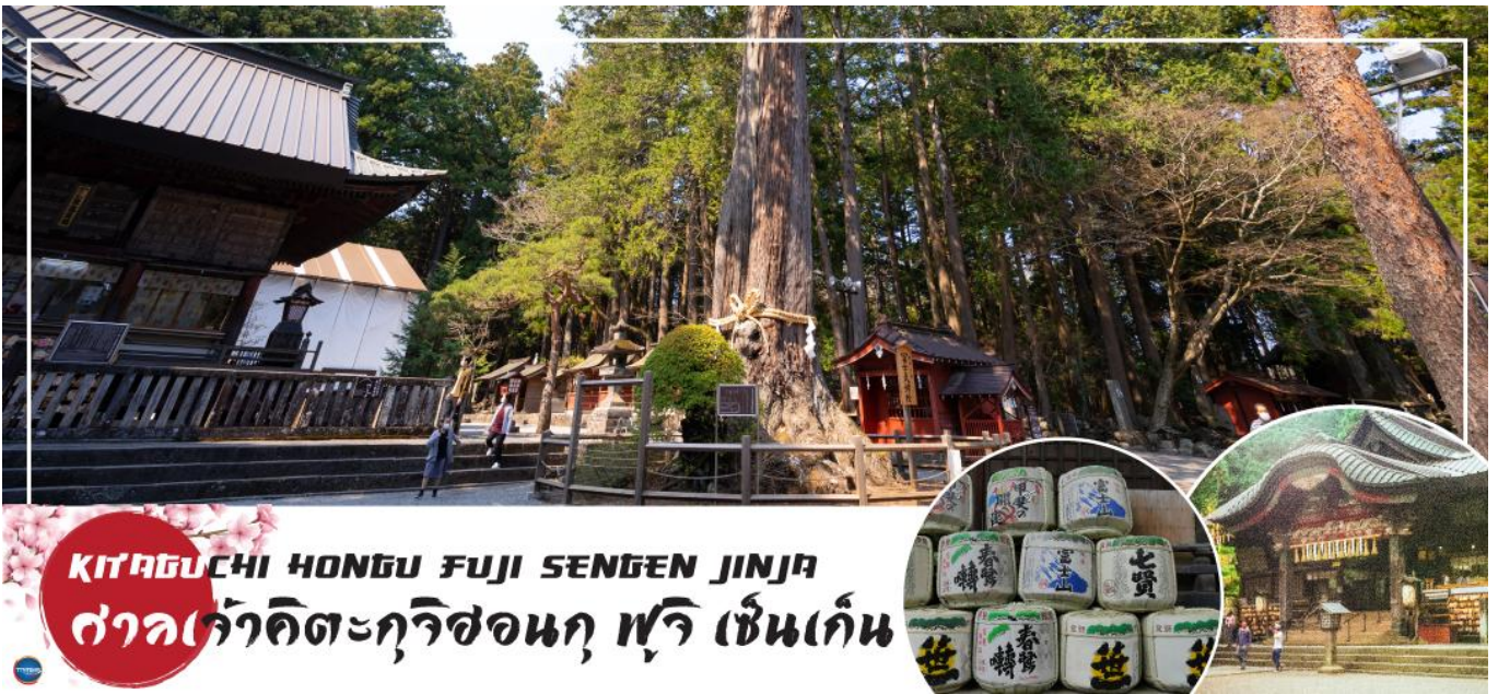
KITAGUCHI HONGU FUJI SENGEN JINJA ศาลเจ้าคิตะกุชิฮงกุ ฟูจิ เซนเกน

นำท่านสักการะ ศาลเจ้าฟูจิโยชิเดเซนเกน (Fujiyoshida Sengen Shrine หรือ Kitaguchi Hongu Fuji Sengen Jinja) เป็นศาลเจ้าเซนเกนหลักที่ตั้งอยู่ทางทิศเหนือของภูเขาไฟฟูจิ ศาลเจ้าฟูจิโยชิเดเซนเกน ตั้งอยู่ในป่าที่ห่างไกลจากถนน จากถนนใหญ่เดินเข้ามาเรียงรายไปด้วยโคมไฟหิน และร่มเงาของป่าไม้สนซีดาร์สูงใหญ่ อาคารต่างๆภายในศาลเจ้าทาด้วยสีแดงตั้งแต่ปี 1615 เดิมทีศาลเจ้าแห่งนี้เป็นจุดเริ่มต้นสำหรับการปีนภูเขาไฟฟูจิจากทางทิศเหนือซึ่งตั้งอยู่ด้านขวาข้างหลังห้องโถงใหญ่ แต่ปัจจุบันนักปีนเขาส่วนใหญ่หันไปเริ่มปีนจาก Fuji Subaru Line สถานีที่ 5