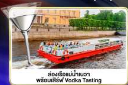
ล่องเรือแม่น้ำเนวา พร้อมเสิร์ฟ Vodka Tasting