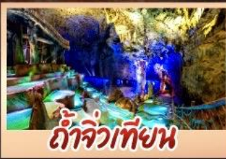
ถ้ำจิวเทียน