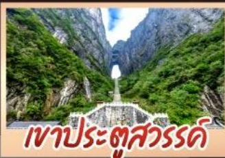
เขาประตูลสวรรค์