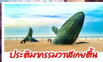
ประติมากรรมวาฬยักษ์ตื่น